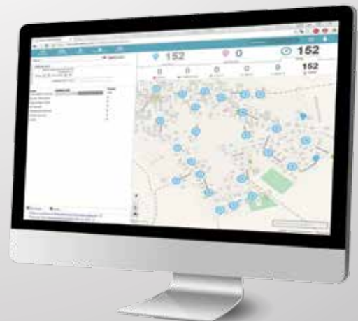
Système de géolocalisation des compteurs