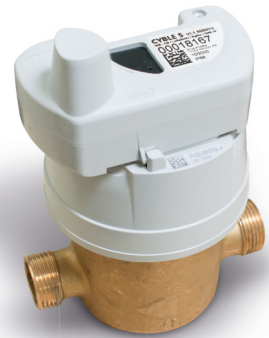
Aquadis + z zainstalowanym modulem Cyble 5